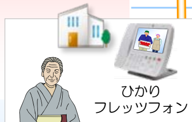
ひかり フレッツフォン