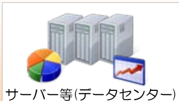
サーバー等(データセンター)