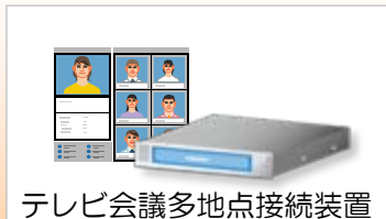
テレビ会議多点接続装置